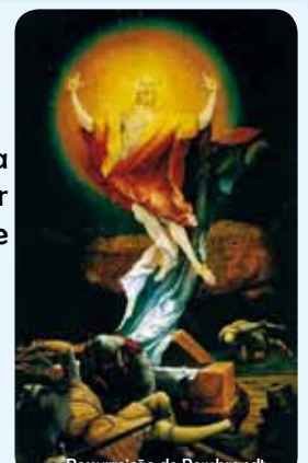
Ressurreição de Rembrandt