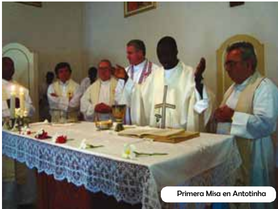
Primera Misa en Antotinha