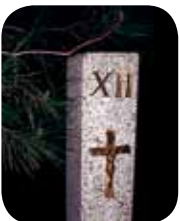
Jovens a caminho em Abril