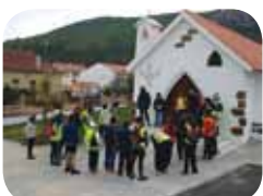
100 Travões IV