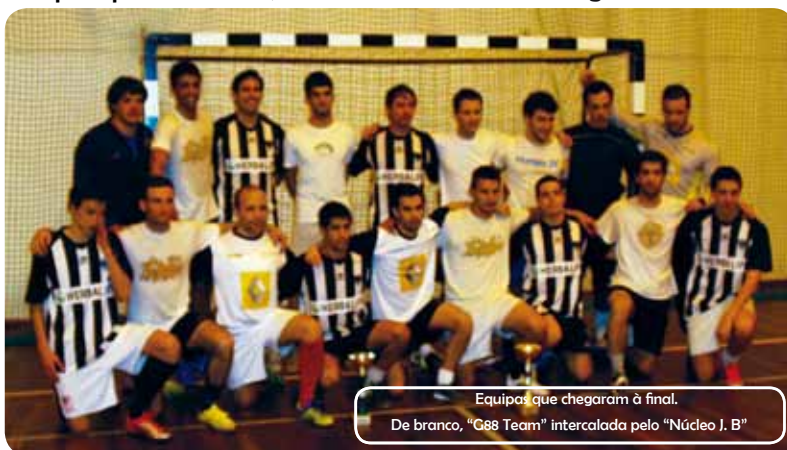
Equipas que chegaram à final. De branco, "G88 Team" intercalada pelo "Núcleo J. B"

Este torneio de futsal realizou-se no passado dia 16 de Abril. Começou por volta das 9 horas e teve a duração de 12 horas. Era o culminar de uma imensa preparação por parte daqueles que querem ir às Jornadas Mundiais da Juventude em Madrid que se realizarão de 15 a 22 de Agosto de 2011. Lá vamos poder ter a oportunidade de conviver com outras