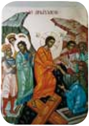
Eu sou o que sou