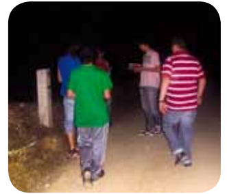
A fazer a Via-sacra