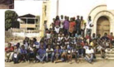
Religião tradicional / Religião Cristã (Jovem) / ...