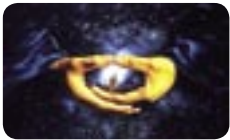
A Audácia de Deus