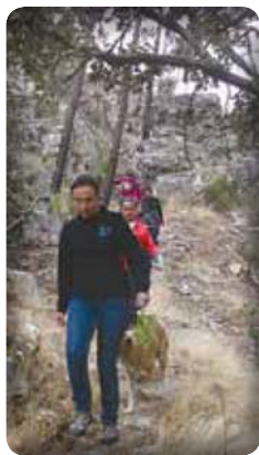
Encontro realizado de 21 a 23 de outubro para comemorar o dia de São Gaspar del Búfalo