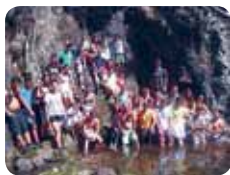
Mundo J 7 Pág. 7

Ficha técnica Missionários do Preciosíssimo Sangue 6510-425 Proença-a-Nova, Portugal 274671222