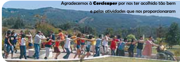
Agradecemos à Cercicaper por nos ter acolhido tão bem e pelas atividades que nos proporcionaram