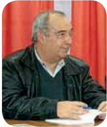
Sede Amigos! Pág. 2

Publicação Trimestral Série III Ano XXIII, Nº 54, Dezembro de 2011