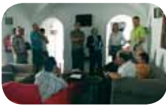
Antigos Alunos Pág. 2