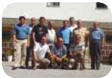
Coisas Nossas Pág. 3