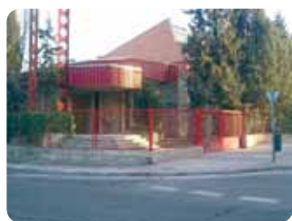
Paróquia de Orcasitas

Agradecemos a Deus as pessoas e este momento JMJ que vivemos em Madrid. Obrigado!