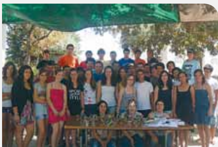
Agradecemos ao Centro de Ciência Viva de Proença-a-Nova pela colaboração nos ateliers

Um desabafo... O Mundo J já faz parte da minha vida a 4 anos, já não é uma experiência nova para mim. Mas mesmo assim todos os anos me surpreendo pela positiva (...) O JAGAS foi sempre algo que me mudou, principalmente pela positiva: aprendi que apesar de cada um ter os seus problemas, de cada um ter o seu modo de ser; somos todos uma família; podemos contar todos uns com outros. (...) Comecei no JAGAS dia 17 Março de 2008 e, desde então, nunca mais saí porque vocês fazem de mim uma pessoa mais feliz e mais completa!